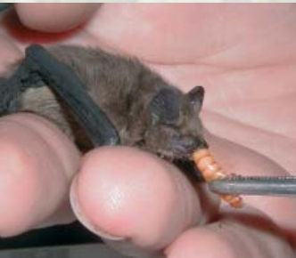
BUND-Helfer füttern eine verunglückte Zwergfledermaus. Diese kleinste europäische Fledermaus wird nur 4-8 g schwer.

Die Tiere finden immer weniger Insektennahrung. Mit dem Ausräumen der Landschaft für Ackerflächen, dem Zuschütten von Kleingewässern, der Rodung von Obstwiesen sowie dem Einsatz von Insektiziden in Landwirtschaft und Gärten werden Insekten immer seltener.